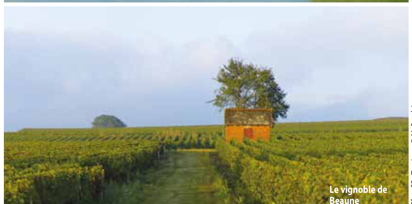
Le vignoble de Beaune