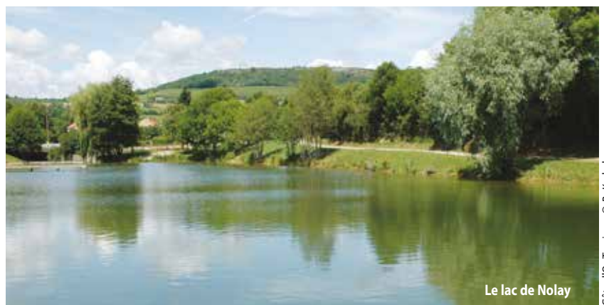
Le lac de Nolay