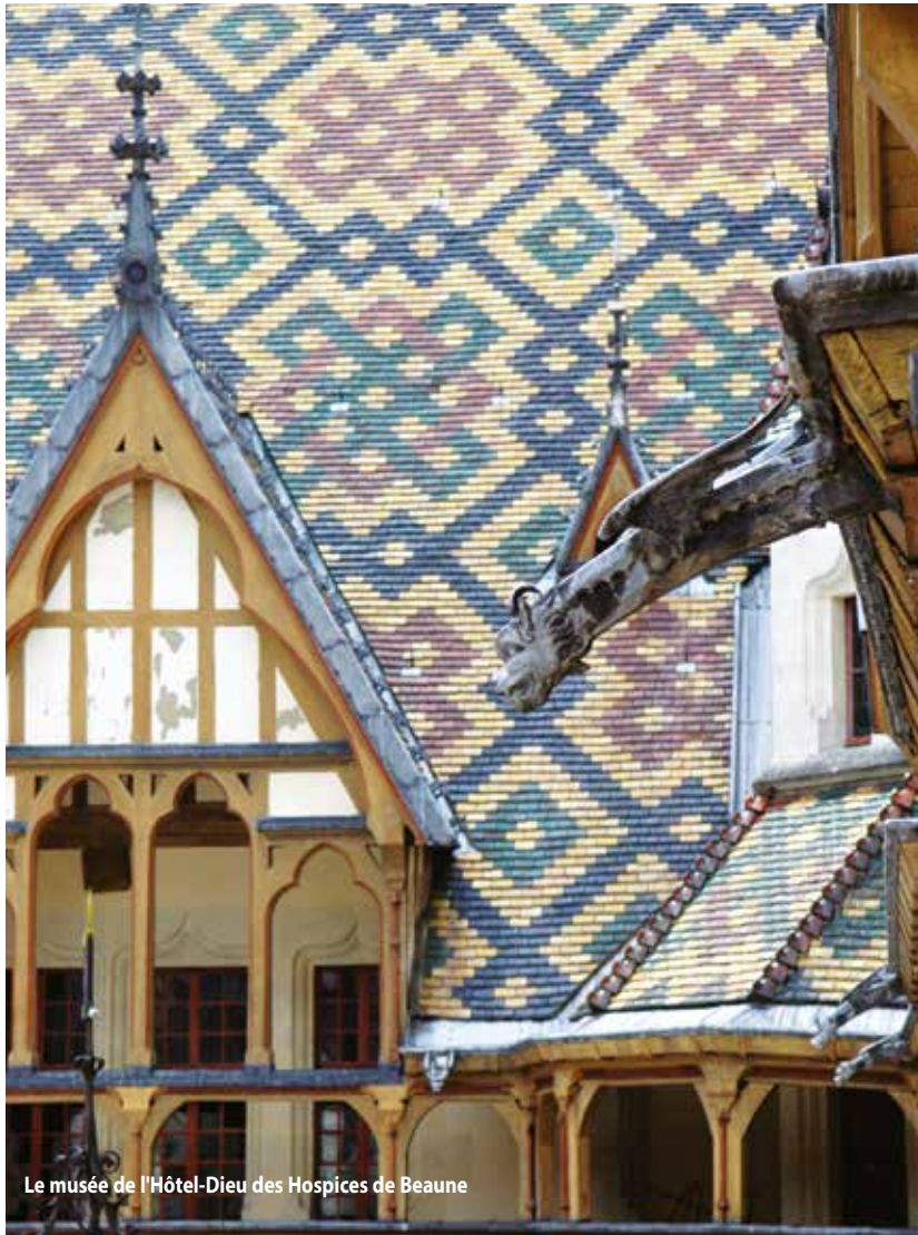
Le musée de l'Hôtel-Dieu des Hospices de Beaune