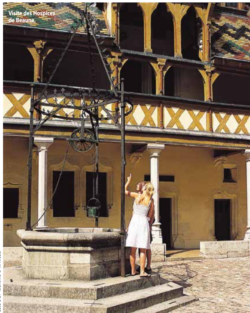
Côte-d'Or, Tourisme © R. Krebel