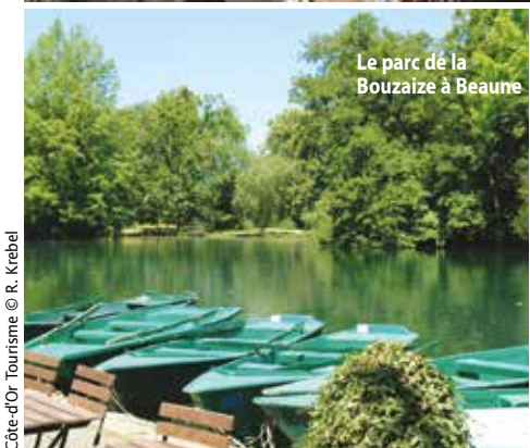
Côte-d'Or Tourisme © R. Krebel